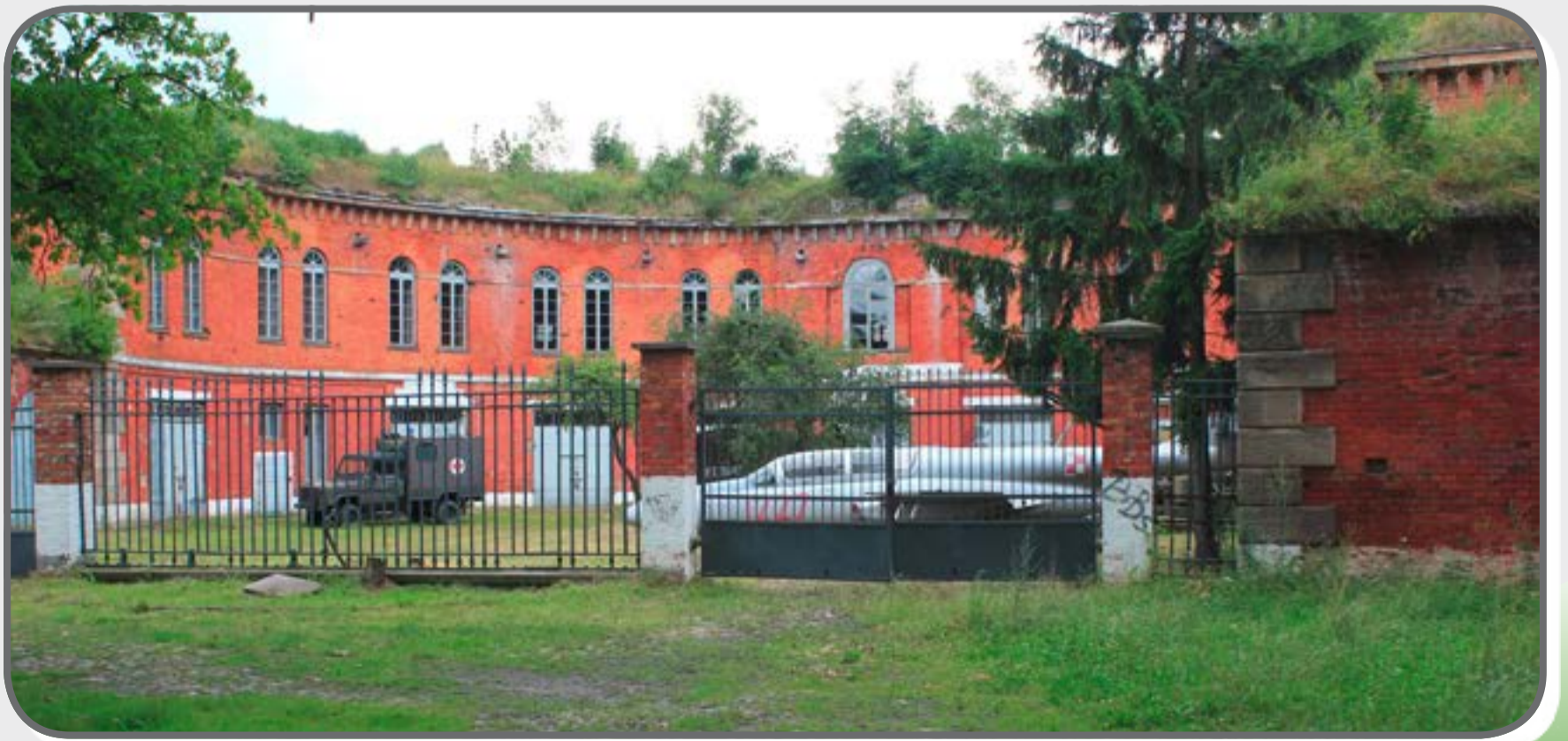
Działobitnia gen. Dehna

Działobitnia gen. Dehna została zbudowana w 1839 r. Nosi imię rosyjskiego generała, który kierował rozbudową twierdzy. Działobitnia była trzykondygnacyjną wieżą, zbudowaną na wzniesieniu. Miała dużą siłę rażenia, wyposażona była w 52 osie artyleryjskie i szerokie pole ostrzału. Otoczona była fosą, a na dole budynku znajdował się system chodników. Idziemy dalej kilkadziesiąt metrów dochodząc do ulicy Bema, skręcamy w prawo i po kilku krokach dojdziemy do ulicy Poniatowskiego. Tu spotykają się dwie nasze trasy.