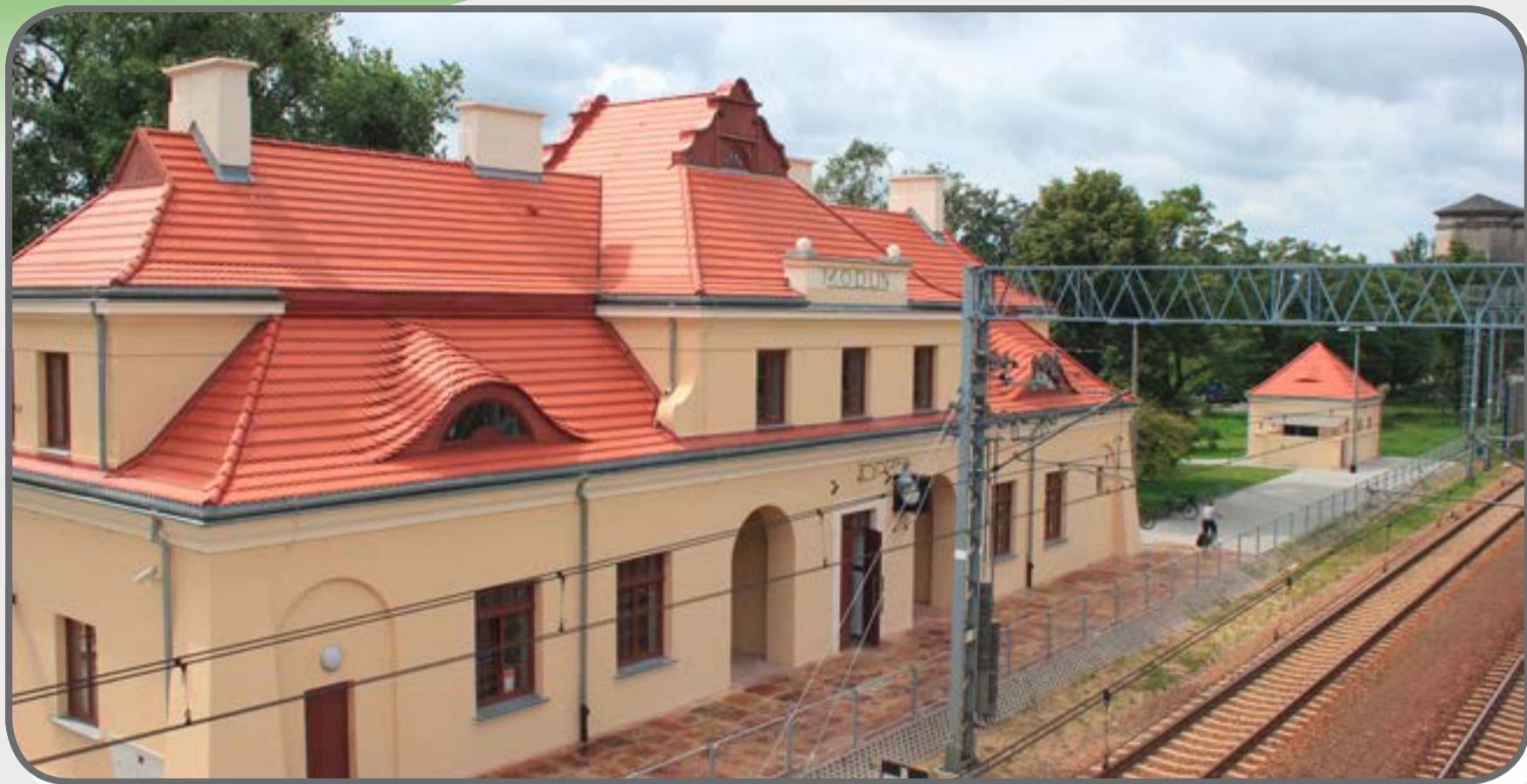
Stacja kolejowa w Modlinie

Wędrówkę zaczynamy na stacji kolejowej w Modlinie , gdzie możemy dojechać wygodnie Pociągami Kolei Mazowieckich. Od dworca do Bramy Ostrołęckiej, którą wejdziemy do twierdzy, dzieli nas około kilometrowy spacer. Idziemy w kierunku centrum, przechodzimy przez przejście kolejowe, idziemy prosto, wyjdziemy wprost na Bramę Ostrołęcką .