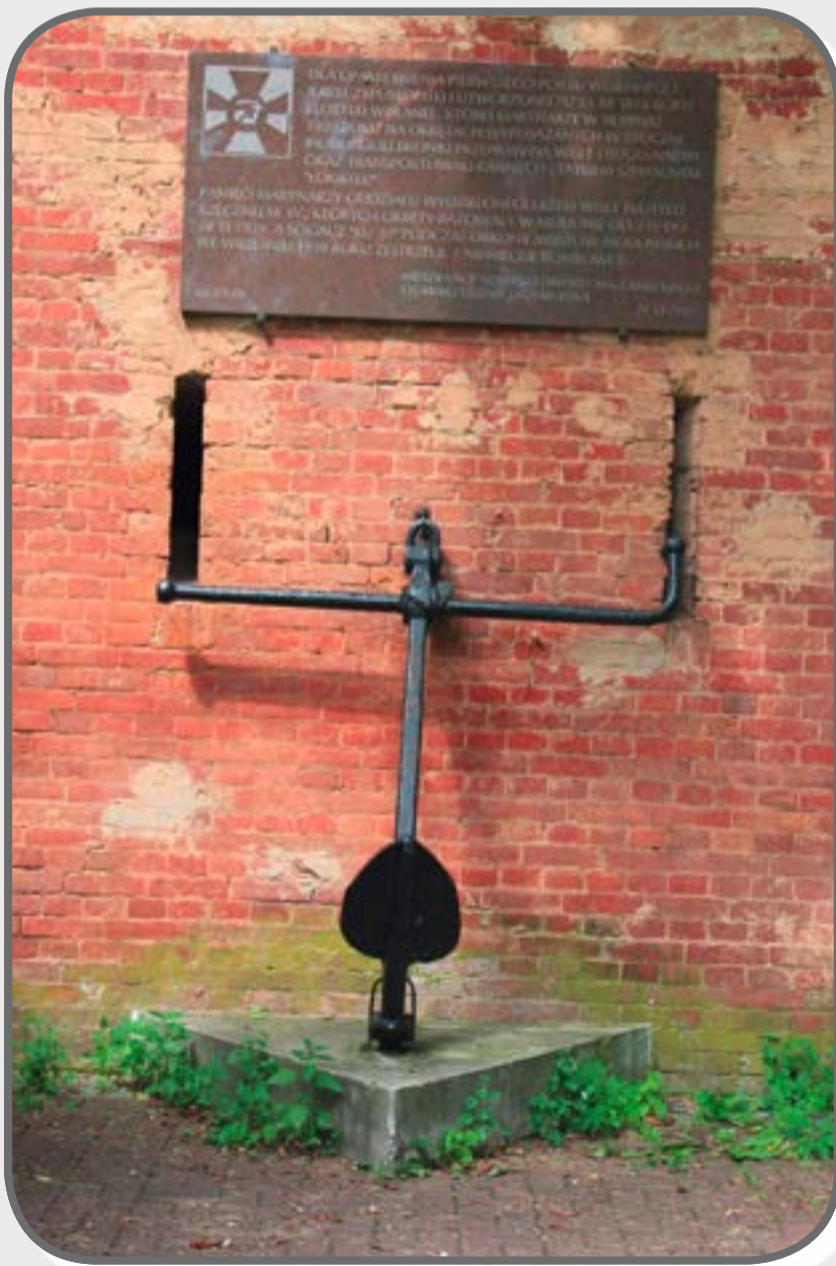
Pomnik Marynarki Wojennej

Upamiętnia on pierwszy port polskiej marynarki wojennej.