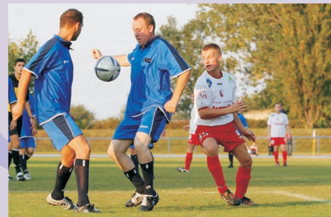
Siedlce - miasto sportu