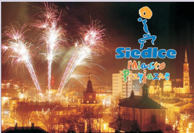
Siedlce - miasto przyjazne