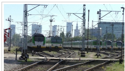
Koleje Mazowieckie ogłosiły przetarg na dostawę 71 pojazdów.

Czytaj: Koleje Mazowieckie policzą pasażerów