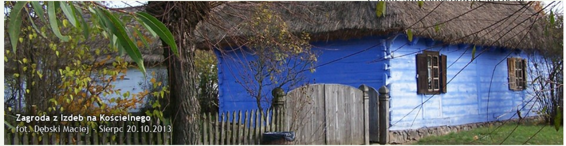
Zagroda z Izdeb na Kościelnego - Sierpc 20. 10. 2013