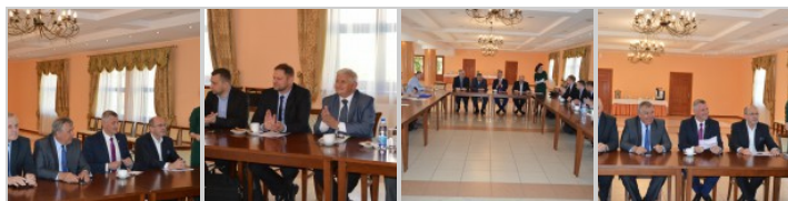
RUMOBIL – kolejny etap projektu!

tekst: http://www.mazovia.pl/aktualnosci/art.5854.rumobil-kolejny-etap.html