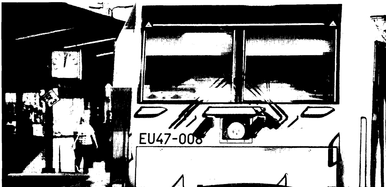
Lokomotywy Bombardiera na peronie Dworca Wschodniego