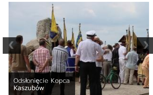
Odsłonięcie Kopca Kaszubów