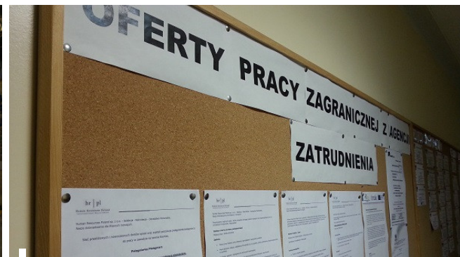
Najświeższe oferty pracy w Radomiu [LISTA WOLNYCH STANOWISK]