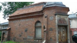
Wycieczka po Radomiu