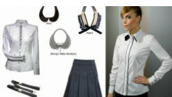
Idealny strój na maturę