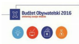
Zdecyduj, na co wydać miliony złotych