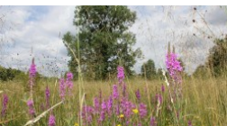
RADOM NA WEEKEND - Las Kapturski (ZDJĘCIA)