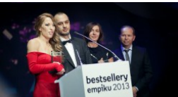
Niegrzeczni chłopcy i herosi na topie! Bestsellery Empiku 2013 rozdane (DUŻO ZDJĘĆ)