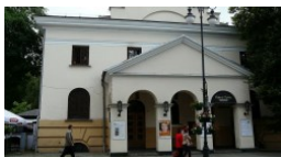
Projekt Rosja w Łażni. Za darmo