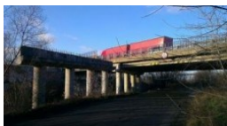
Będą nowe wiadukty na Żółkiewskiego!