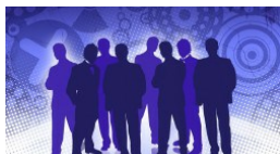
Miliony dla bezrobotnych