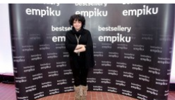
Bestsellery Empiku 2012 rozdane! (DUŻO ZDJĘĆ)