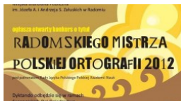
I ty możesz zostać mistrzem ortografii