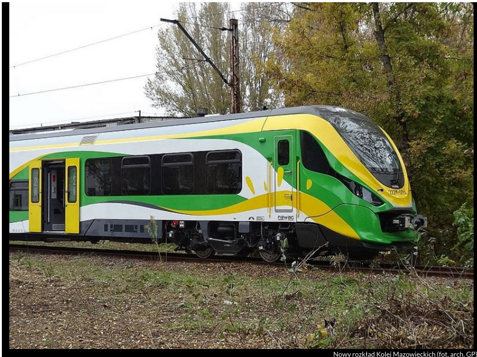
Nowy rozkład Kolei Mazowieckich