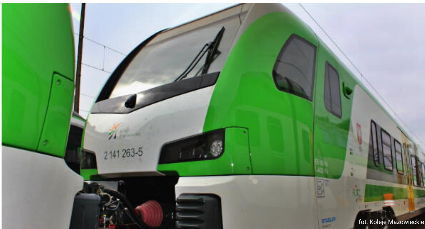
fol. Koleje Mazowieckie