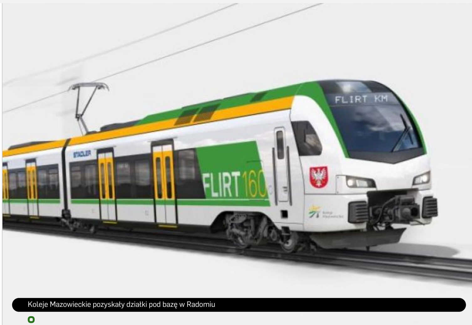
Koleje Mazowieckie pozyskały działki pod bazę w Radomiu