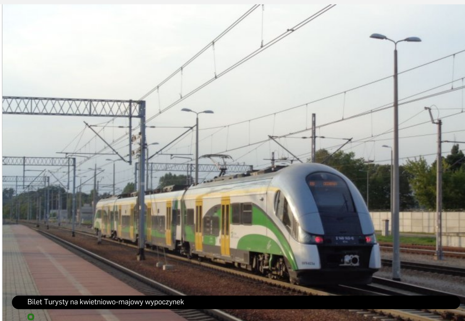
Bilet Turysty na kwietniowo-majowy wypoczynek

W związku ze zbliżającymi się Świętami Wielkanocnymi oraz długim weekendem majowym Koleje Mazowieckie zachęcają do korzystania z oferty Bilet Turysty. Tym razem oferta obowiązuje od 19 kwietnia do 5 maja.