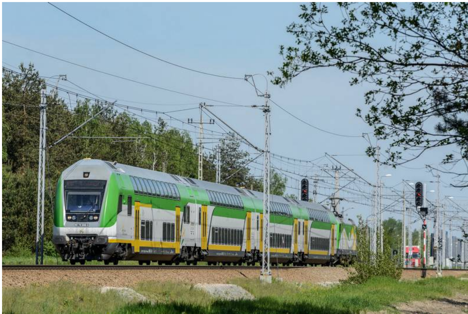
Fot: Adam Kilian