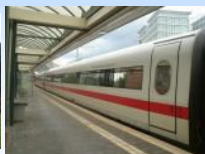
ICE 1 klasa