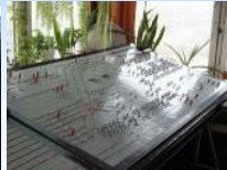
Łódź Olechów - Na...