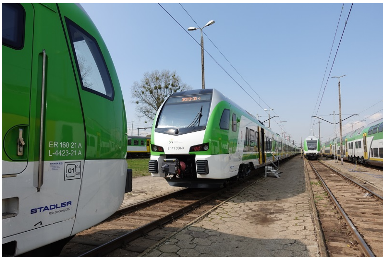
Przekazany 30 Flirt w stacji postojowej Kolei Mazowieckich.

Kontrakt ramowy na 61 pięcioczonowych pojazdów typu FLIRT, zawarty pomiędzy przewoźnikiem a producentem w 2018 roku, jest realizowany przy wsparciu środków unijnych z RPO WM 2014-2020 (dofinansowanie w wysokości 96,16 mln zł) oraz z POIiŚ 2014-2020 (dofinansowanie w wysokości 580 mln zł).