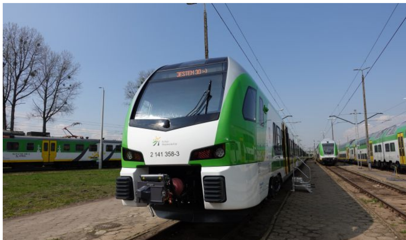
30 Flirt w barwach Kolei Mazowieckich.

Dziś (29.04.2022r) do parku taborowego Kolei Mazowieckich dołączył 30. FLIRT, odebrany w ramach III umowy wykonawczej. Wartość tej umowy to prawie 400 mln zł brutto, z czego dofinansowanie ze środków UE wyniosło około 120 mln zł. Nowy eżt będzie obsługiwał połączenia na trasie Skierniewice - Warszawa - Mińsk Mazowiecki.