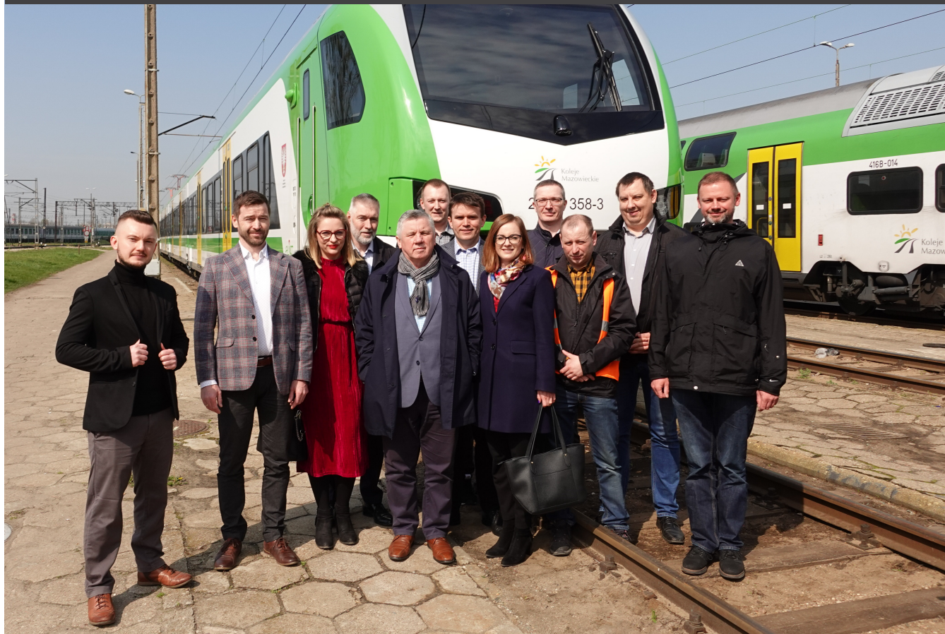
Przekazany 30 Flirt w stacji postojowej Kolei Mazowieckich.

Zgodnie z zawartą umową przedwstępną Koleje Mazowieckie i Stadler podpisały pięć kontraktów wykonawczych. Ostatni z nich zawarty 27 kwietnia br. dotyczy dostawy 16 pięcioczonowych elektrycznych zespołów trakcyjnych typu FLIRT. Oznacza to, że już w drugiej połowie 2023 roku Koleje Mazowieckie będą posiadały komplet 61 nowoczesnych, niezawodnych i komfortowych pojazdów FLIRT wyprodukowanych w siedleckim zakładzie Stadlera.