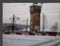
W Krzeszowicach powstanie wiadukt kolejowy