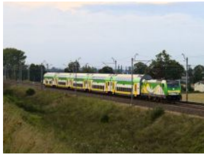
Pociągiem Kolei Mazowieckich po kulturę