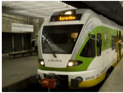
Kursowanie pociągów KM w związku ze zmianą czasu na letni