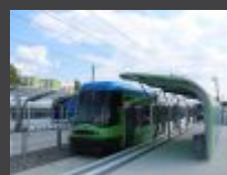
Kolejna pula unijnego dofinansowania na tramwaje w Szczecinie