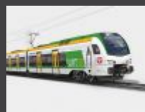
Koleje Mazowieckie pożyczą 1 mld zł na tabor