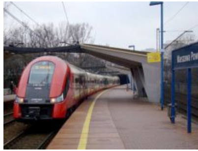
Wzajemne honorowanie biletów ZTM, KM, PR, WKD i ŁKA podczas remontu „średnicy”