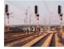
Ryś: w projektach linii kolejowych zapomina się o ergonomii