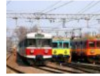
Do 11 kwietnia potrwa referendum strajkowe w PR