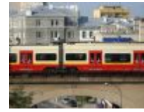
Organizacje pozarządowe apelują o zmianę koncepcji remontu średnicy