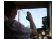
Europejski Dzień Maszynisty