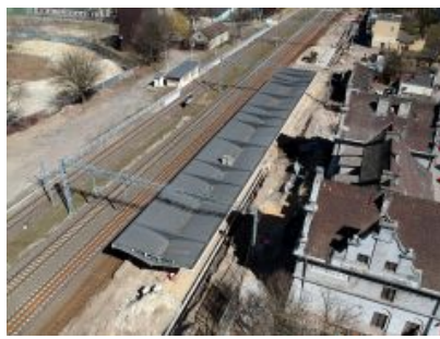
24 września otwarcie linii grodzkiej. Stacja Pruszków nieczynna dłużej