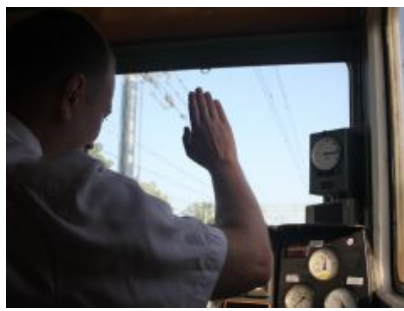
Europejski Dzień Maszynisty