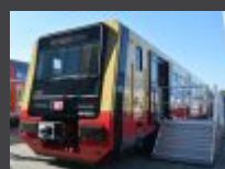
Nowy tabor dla berlińskiej S-Bahn zaprezentowany