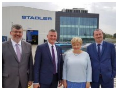
W Siedlcach powstają pierwsze FLIRT-y dla Kolei Mazowieckich