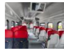
Polski tabor na InnoTrans 2018