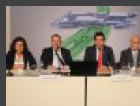
Przejęcie Solarisa było dla CAF wyjątkową okazją