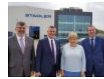
W Siedlcach powstają pierwsze FLIRT-y dla Kolei Mazowieckich