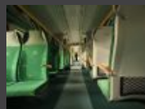
22 września darmowe przejazdy pociągami KM