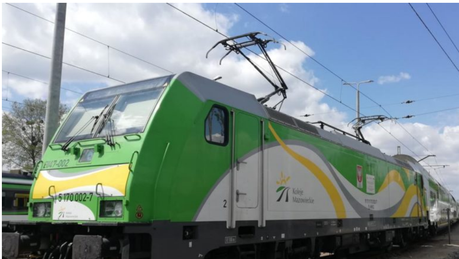
Pociąg Słoneczny