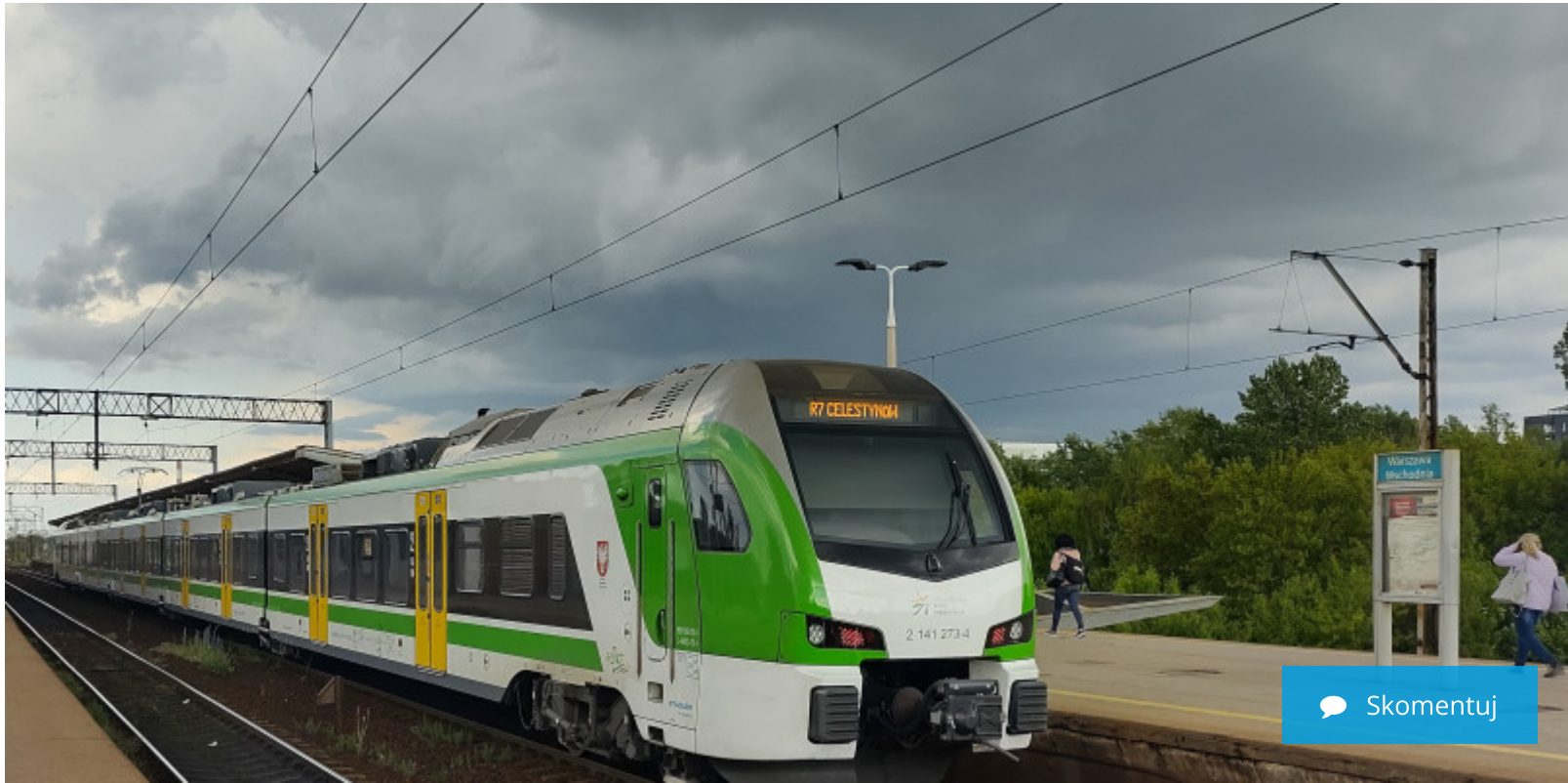
Zwiedzaj Mazowsze z Biletem Turysty Kolei Mazowieckich