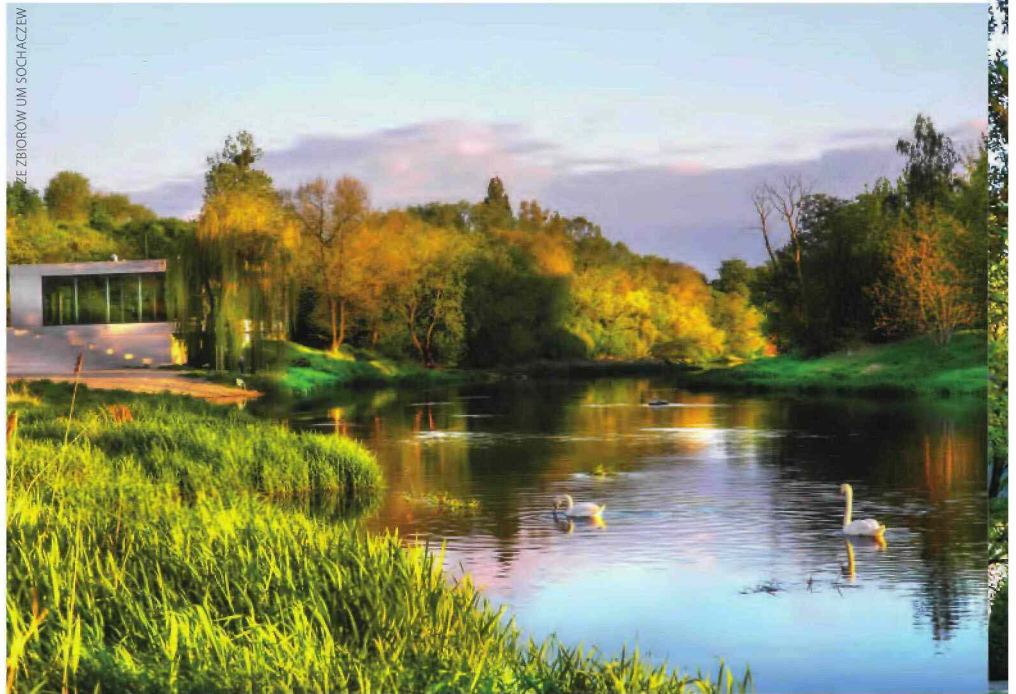
Przy bulwarach spacerowych nad Bzurą mieści się kawiarnia. Urządzona jest też plaża z kąpieliskiem.

czej Przedsiębiorstwa Energetyki Ciepłej (PEC). To oznacza konieczność budowy zakładu geotermalnego i przebudowy dużej części systemu dostaw ciepła – uzasadnia burmistrz i jednocześnie informuje, że PEC złożył wniosek w Narodowym Funduszu Ochrony Środowiska i Gospodarki Wodnej o dofinansowanie zadania wartego około 30 mln zł. Projekt przeszedł już pozytywnie ocenę formalną.