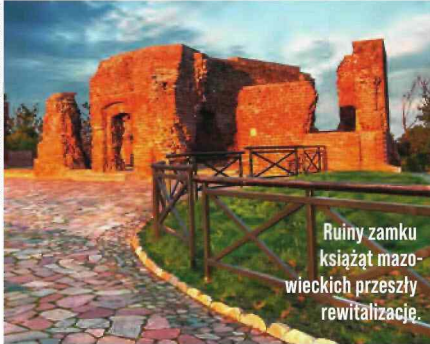
Ruiny zamku książąt mazowieckich przeszły rewitalizację.