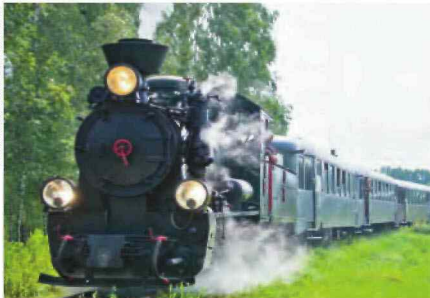
Trasa pociągu Retro wiedzie przez urokliwe tereny i kończy się przy Kampinoskim Parku Narodowym.