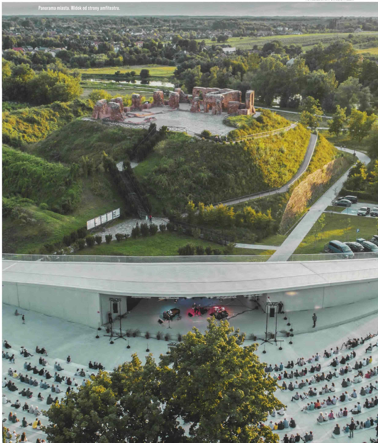
Panorama miasta. Widok od strony amfiteatru.