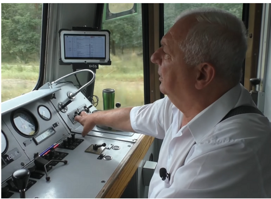
Mat. Koleje Mazowieckie

17 września 2020 | przez Adrian Izydorek | 0 komentarzy