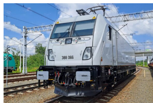
PCC Intermodal odebrał cztery nowe Traxxy 3 lipca 2023