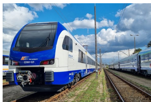
PKP Intercity odebrało 6 z 12 nowych Flirtów. Zakończenie dostaw do końca... 4 lipca 2023