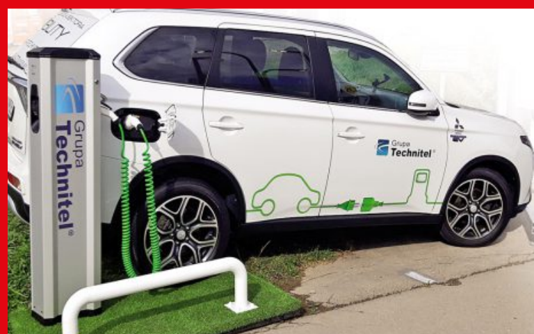
28 grudnia 2019