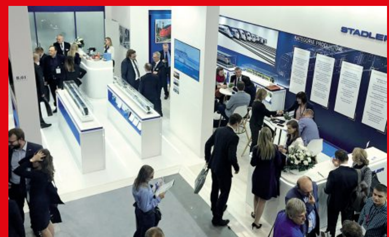
27 grudnia 2019