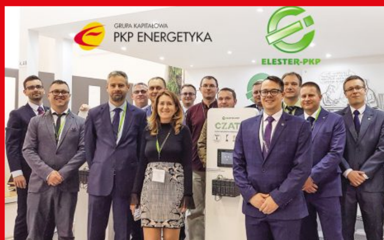
28 grudnia 2019