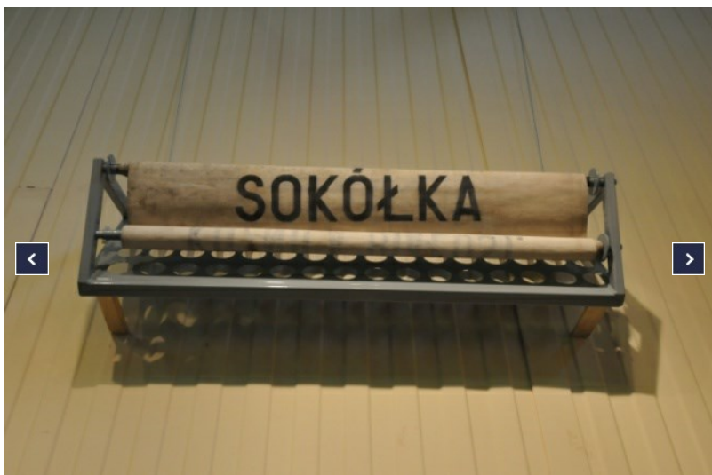
Wystawa "10 lat Kolei Mazowieckich".