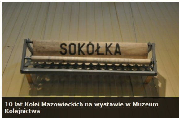
10 lat Kolei Mazowieckich na wystawie w Muzeum Kolejnictwa