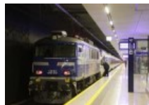
Nie wszystkie pociągi PKP Intercity...