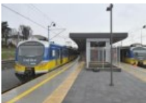
Plany SKM Trójmiasto: Nowoczesna blokada,...