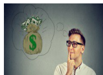
Martwi Cię brak gotówki? Sprawdź Vivus.pl