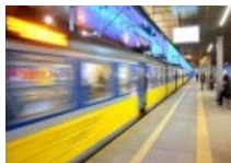
PKP SKM Trójmiasto z 42 mln pasażerów...