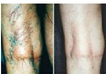
Wygląda żyłaki u każdego! Blogerka...