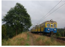
Trójmiejska SKM z jedną ofertą na naprawę okresową EN57