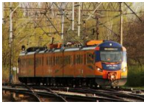
Łódź: Kolej otworzy się na Retkinię