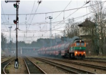
Torpoł zwyciężcą przetargu na kolej do Lubina