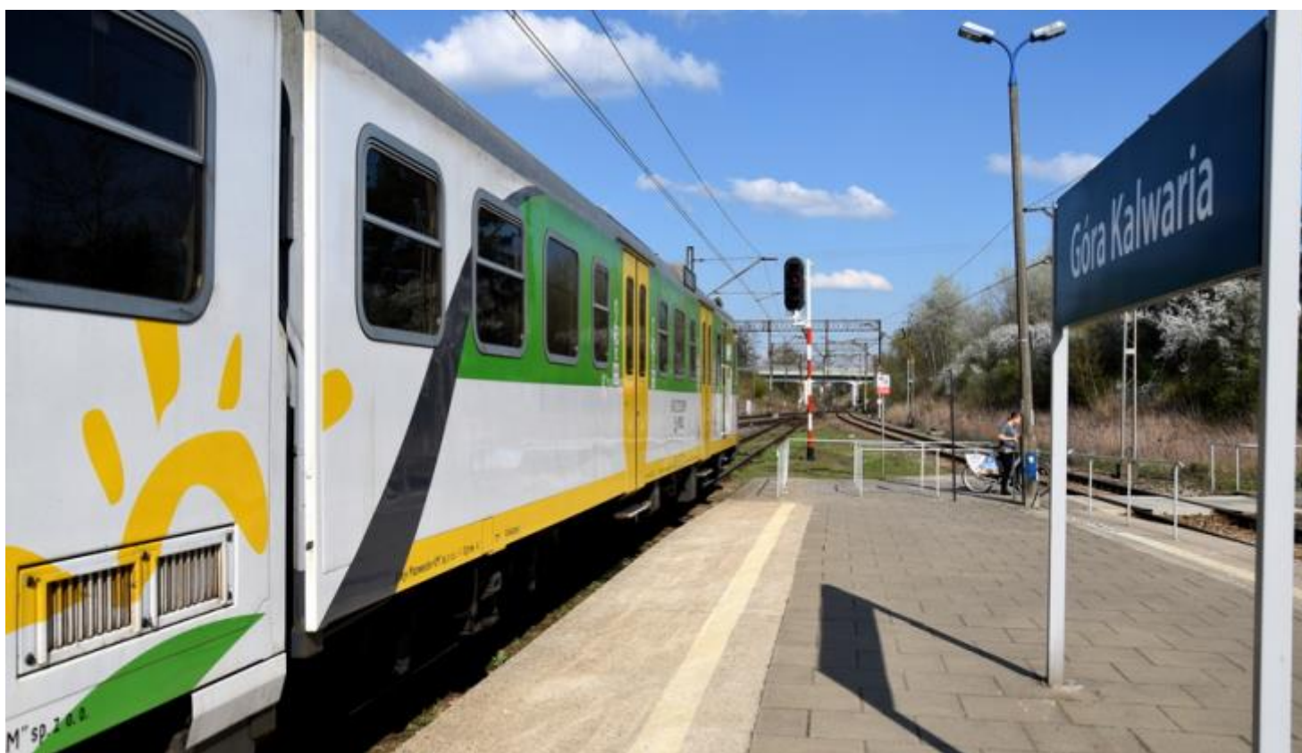
Pociąg KM w Górze Kalwarii