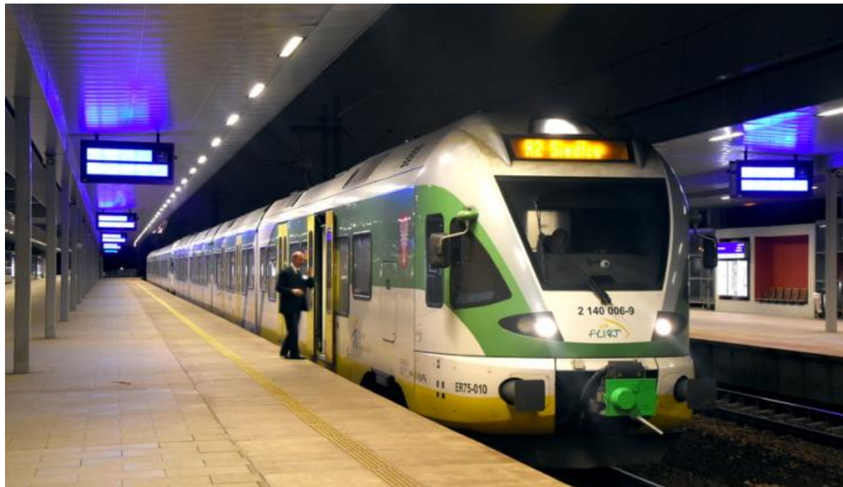
fol. M. Szymajda

Poza zmianą rozkładu jazdy, 12 grudnia na Mazowszu w pociągach regionalnych wejdą w życie także podwyżki.