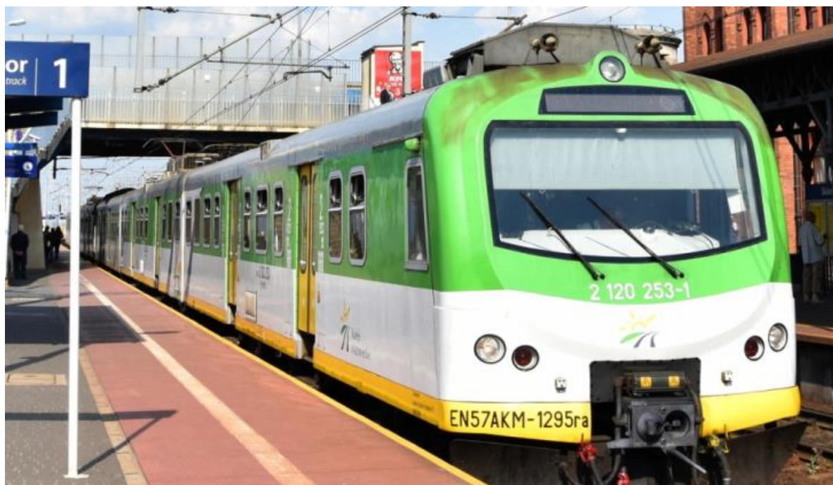
Fot. ms (zdjęcie ilustracyjne)

Sezonowa korekta rozkładu jazdy PKP Polskich Linii Kolejowych już po raz drugi w tym roku rozpoczęła się wielkimi problemami pasażerów w Warszawie. Wstępne ustalenie przyczyn problemów, które rozpoczęły się wcześniej rano w niedzielę 3 września, prowadzą, zdaniem Kolei Mazowieckich, do wniosku, że zarządca linii kolejowych skierował pociąg spółki... na tor bez sieci trakcyjnej.