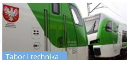
Tabor i technika

Szynobus KM spłonął, drugi uczestniczył w wypadku [zdjęcia] Jakub Madrjas 16 stycznia 2024