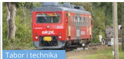
Tabor i technika

Szynobusy SKPL już obsługują połączenia Kolei Mazowieckich Jakub Madrjas 24 stycznia 2024