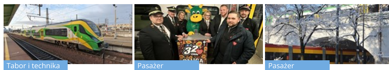
Tabor i technika