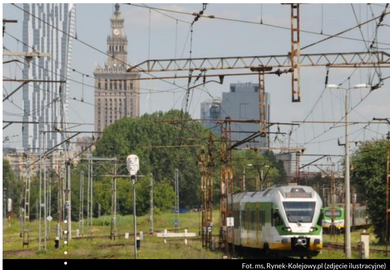
Fot. ms, Rynek-Kolejowy.pl (zdjęcie ilustracyjne)

Od 5 do 17 lipca pociągi Kolei Mazowieckich i niemal wszystkie pociągi SKM Warszawa nie dojadą na Lotnisko Chopina. Będą kończyły kursy na stacji Warszawa Zachodnia. Pojawi się znacznie więcej miejskich autobusów.