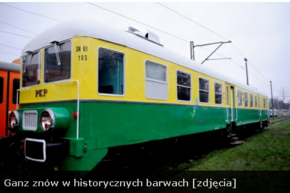
Ganz znów w historycznych barwach [zdjęcia]