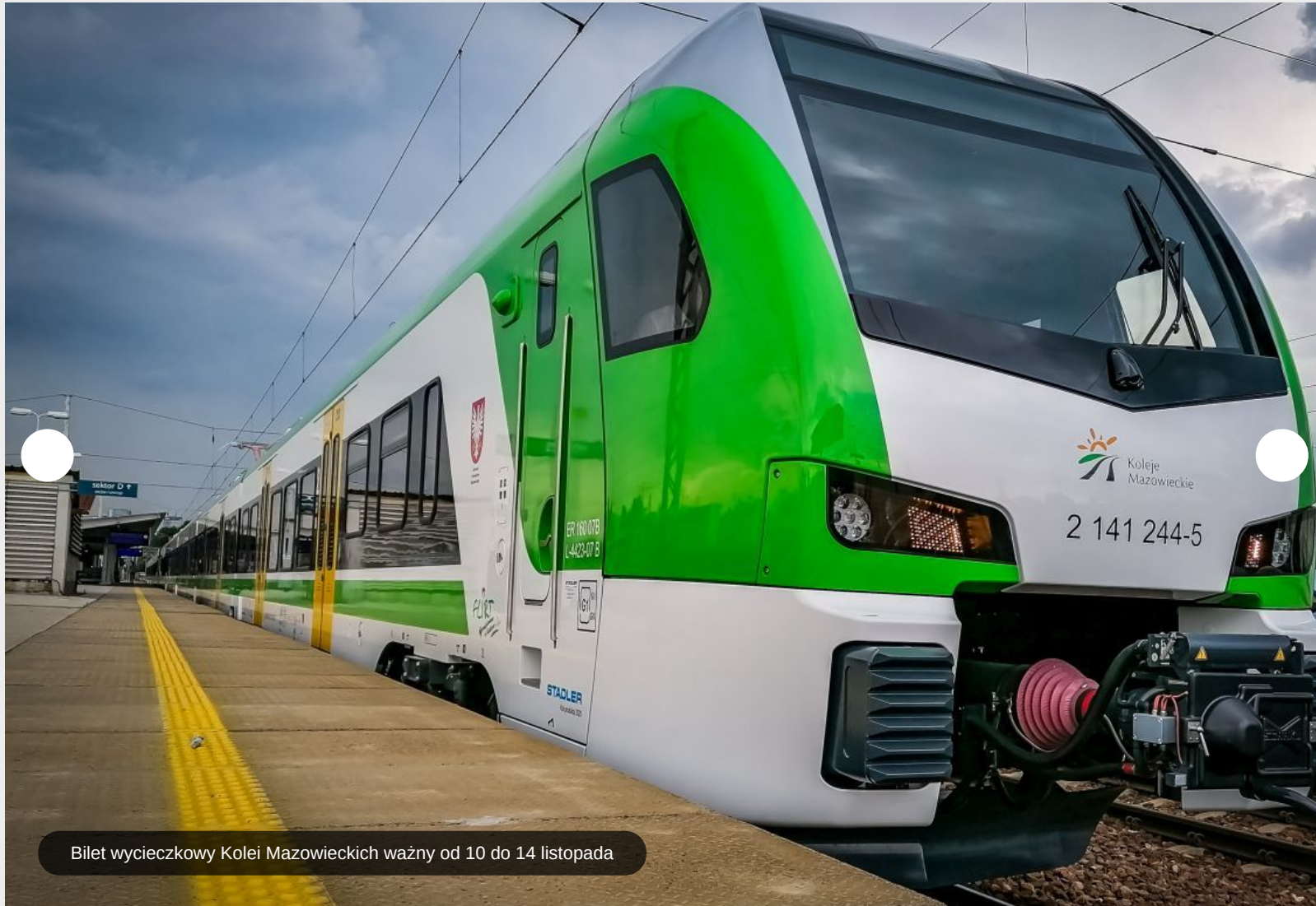
Bilet wycieczkowy Kolei Mazowieckich ważny od 10 do 14 listopada