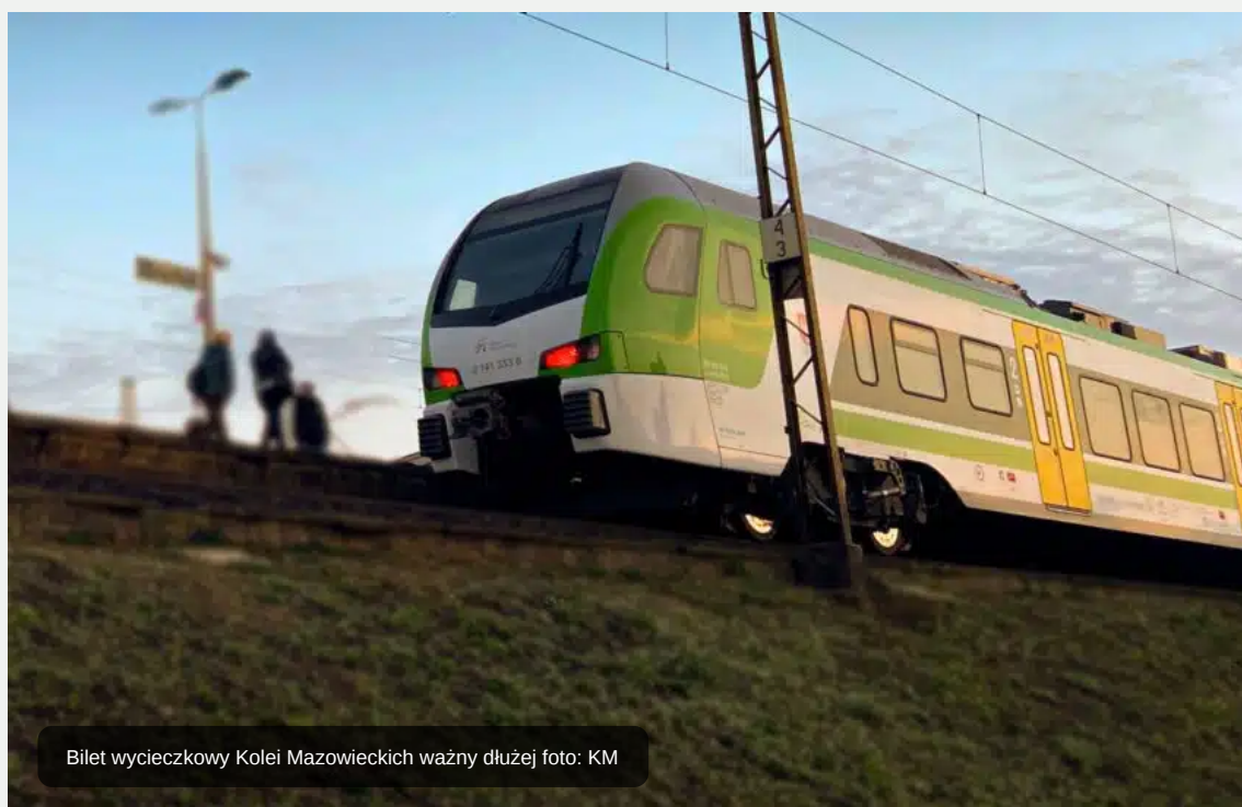
Bilet wycieczkowy Kolei Mazowieckich ważny dłużej

Koleje Mazowieckie przedłużają okres obowiązywania oferty bilet wycieczkowy o poniedziałek 31 października 2022 roku.