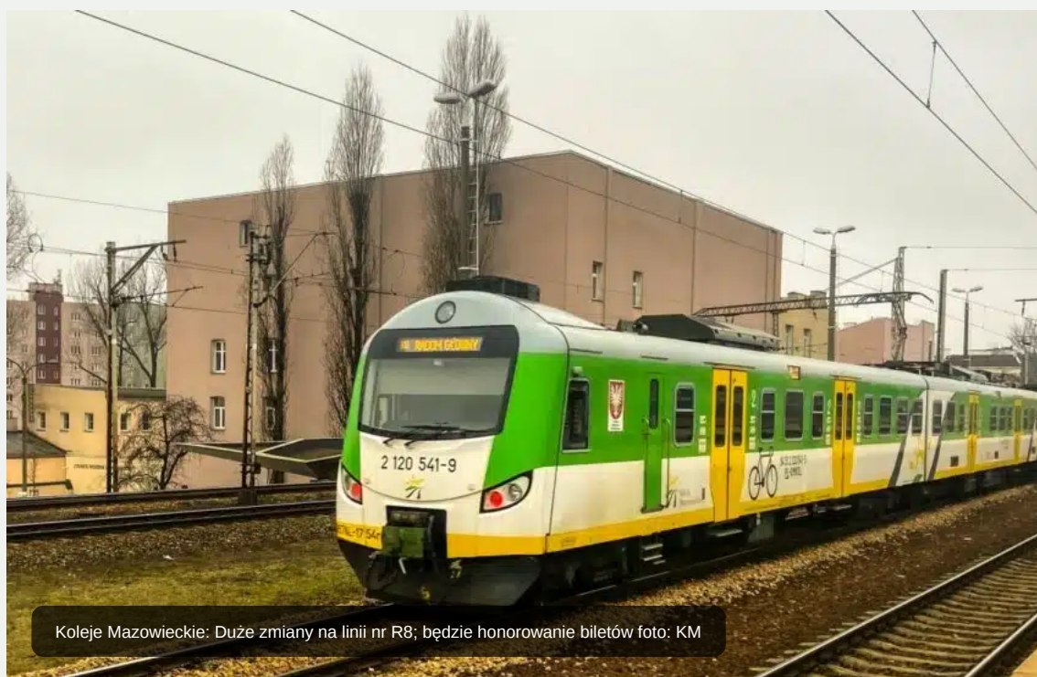
Koleje Mazowieckie: Duże zmiany na linii nr R8; będzie honorowanie biletów

W związku z szerokim zakresem prac modernizacyjnych, prowadzonych przez zarządcę infrastruktury kolejowej, czyli PKP PLK S.A. m.in. na stacji Warszawa Zachodnia, od 12 marca 2023 r., zostanie wprowadzona korekta rozkładu jazdy, która będzie obowiązywać do 10 czerwca 2023 r.