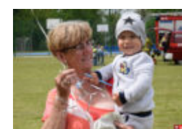
Dzień Dziecka w Gminie Regimin [FOTORELACJA] 30 maja 2021