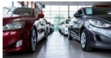
Wypożyczenie samochodu w Warszawie