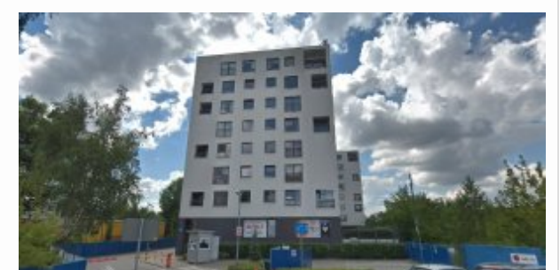
Pożar w garażu na Woli