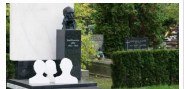
Syn w hołdzie Ojcu