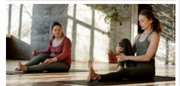
Mazowiecka Lady D.