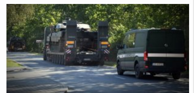
Ruchy wojsk na Mazowszu