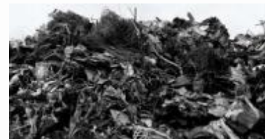
Kryzys śmieciowy na Mazowszu