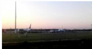
Koleje Mazowieckie wspierają Modlin